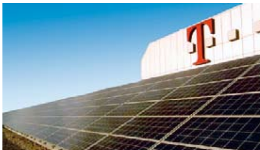
Klimaschutz: Telekom setzt alternative Energie ein.