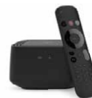
MagentaTV Box **