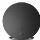
Speed Home WLAN

* Extraleistung bei Miete: MagentaZuhause App Pro (verfügbar ab Ende März) und schneller Gerätetausch bei Defekt inklusive.