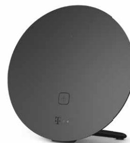
Speed Home WLAN

Sie haben schon einen aktuellen Router wie z. B. den Speedport Smart 4 oder Speedport Pro Plus und möchten Ihr WLAN optimieren? Dann sind unsere WLAN Pakete genau das Richtige für Sie. Sie ermöglichen, zusammen mit einem geeigneten Router, in Ihrem Zuhause eine optimale WLAN-Abdeckung mit Wi-Fi-6-Standard und Mesh-Technologie. Unterstützung bei der Installation und der WLAN-Optimierung ist ebenfalls inklusive.